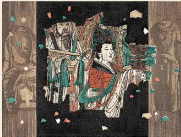
版畫 緬懷傳統 1999

鄔繼德的墨彩畫中，期望傳達出中西合璧的藝術光彩。以版畫視覺成就墨彩技法，墨韻與印痕的交替互補將成就不一樣的自然形態之美。