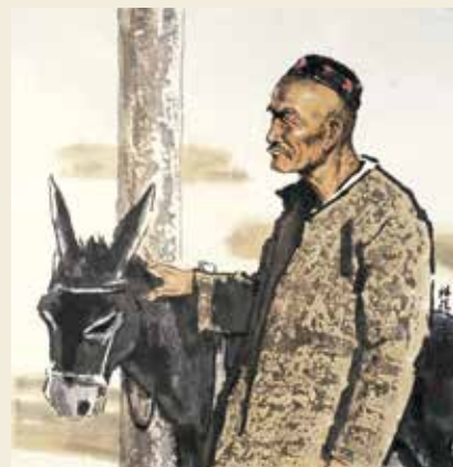
墨彩 扶驢老漢 2010