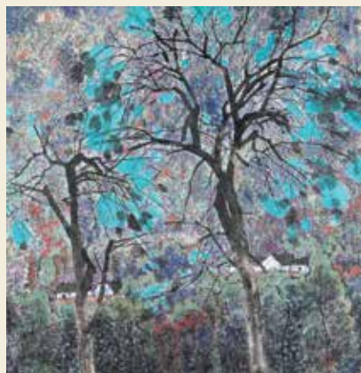
墨彩 山寨添翠 2005