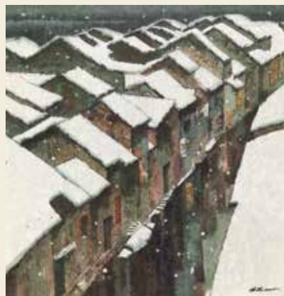
墨彩 江南雪 2005