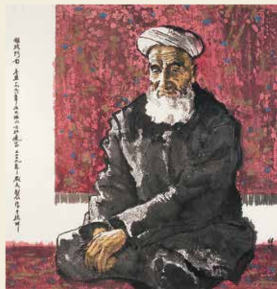
墨彩 回族阿訇 2009